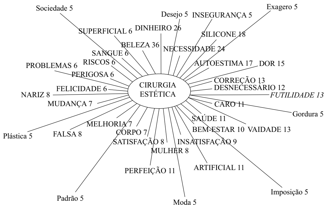
Figura 3. Rede Associativa do termo Cirurgia Estética