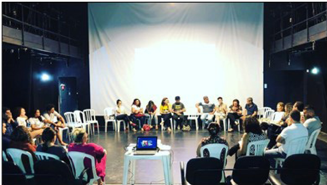
Figura 1 – Encontro Mensal do Fórum de Escolas em fevereiro de 2020.