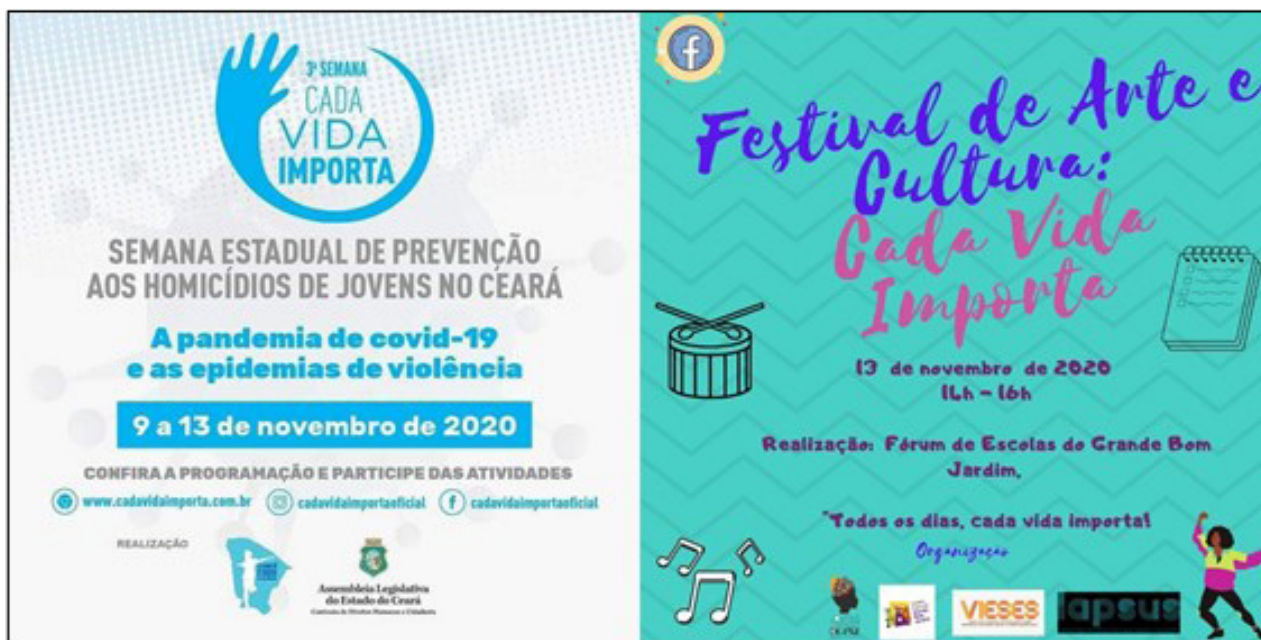
Figura 3 – À direita, cartaz da Semana Cada Vida Importa (2020), e à esquerda, cartaz do Festival de Arte e Cultura: Cada Vida Importa (2020).