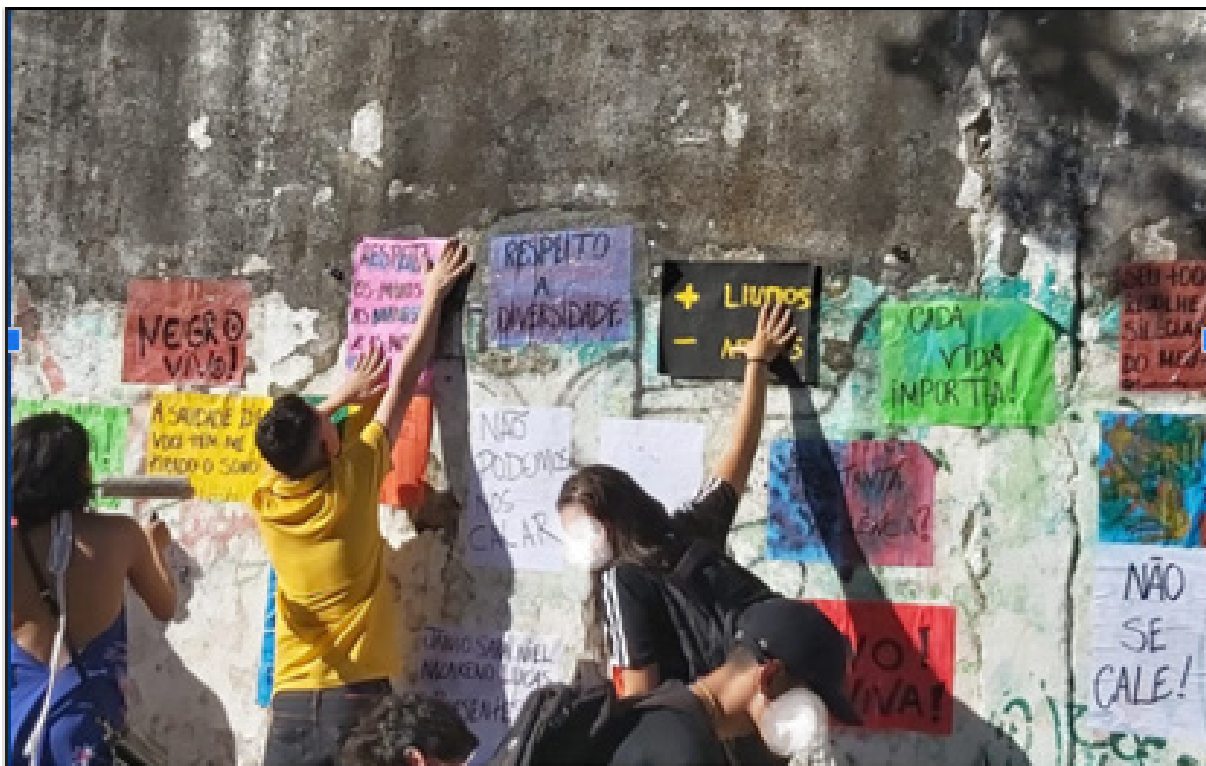
Figura 2 – Colagem de Cartazes fruto de um momento coletivo de produção de memória pelas vidas perdidas pela violência armada.