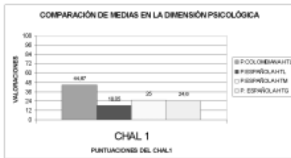
Figura 1. Comparación de medias del CHAL (EA) y de la investigación de Roca-Cusachs, et. al., (2001)