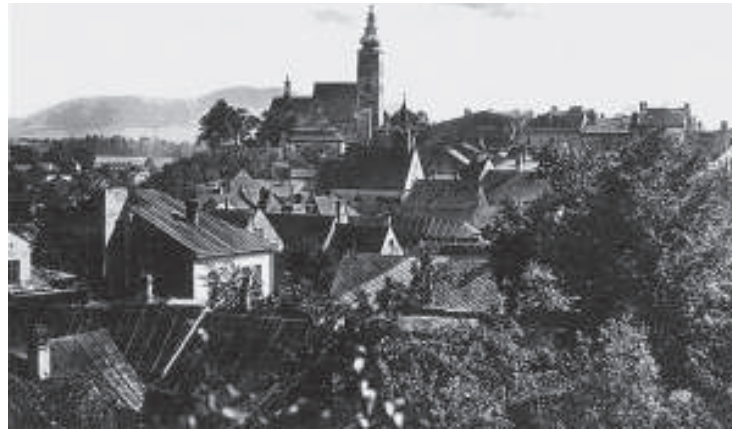
Freiberg, Morávia. 3

Sigmund Freud, Viena, 31 de dezembro de 1874 2