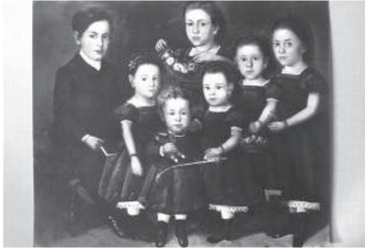
Sigmund Freud, 1867. Sigmund ao fundo, junto a Anna. No canto direito, Rosa; ao lado, Mitzi; as duas fotografias do mesmo tamanho correspondem a Paula (à esquerda) e Dolfi (à direita). Todas elas irmãs de Freud. E, finalmente, o pequenininho é seu irmão menor, Alexander. 5