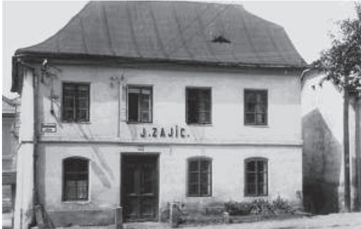
A casa de Sigmund Freud em Freiberg, Morávia. 4