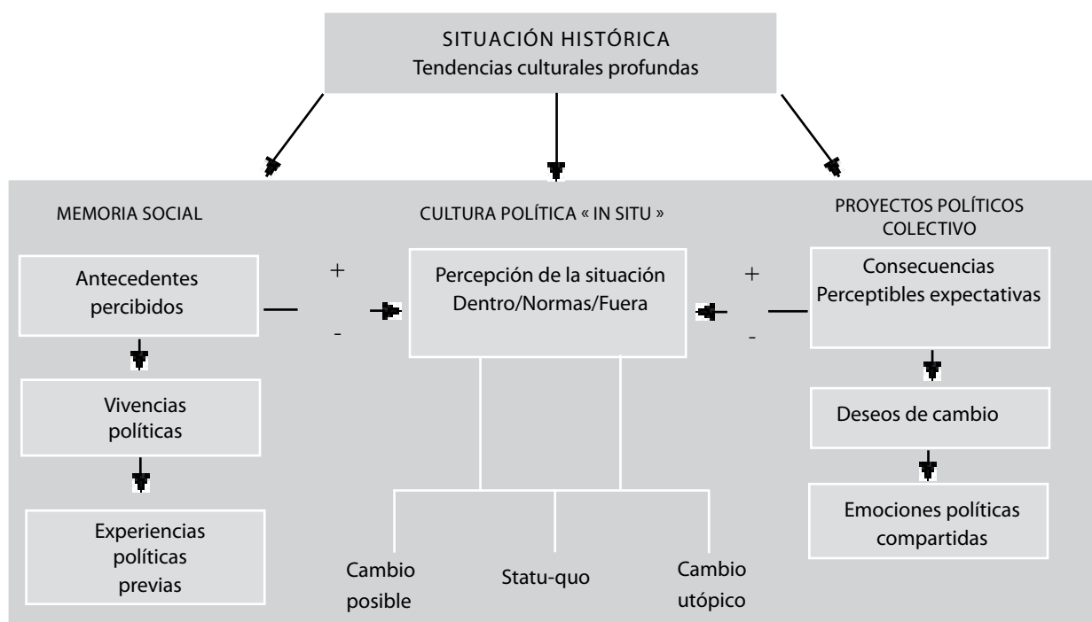
Figura 1 Esquema heurístico de la psicología política

En acuerdo con numerosos politólogos actuales (Sartori, Manin, Dobry) podemos decir que lo que actualmente esta en crisis no solo apunta a la representación de la democracia, sino que aun mas a la legitimidad del sistema de democracia representativa. Los ciudadanos ignoran los mecanismos que regulan el proceso democrático y sus instituciones, tanto como su propio funcionamiento. Hay un «síndrome democrático». Lo hemos descrito y comentado en trabajos anteriores (Dorna 2004). Recordaremos brevemente algunas premisas: