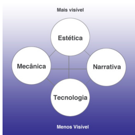
Figura 1: Tétrade com os 4 elementos essenciais para o design do jogo (Schell 2009, p. 42)

Salen e Zimmerman (2003) sugerem que o enquadramento conceitual dos jogos eletrônicos seja feito a partir de três perspectivas básicas, que podem abrir espaço para esquemas mais detalhadas: as regras do jogo, a experiência do jogador, e a experiência cultural. Dessa forma, o ato de jogar e brincar pode ser visto a partir de três perspectivas: a partir das regras do jogo (como sistema formal e restrito), a partir da experiência lúdica do jogador (que inclui o sistema de regras), ou a partir de um conceito mais amplo de experiência cultural (que inclui o jogar, o brincar e as regras), como exemplifica a Figura 2.