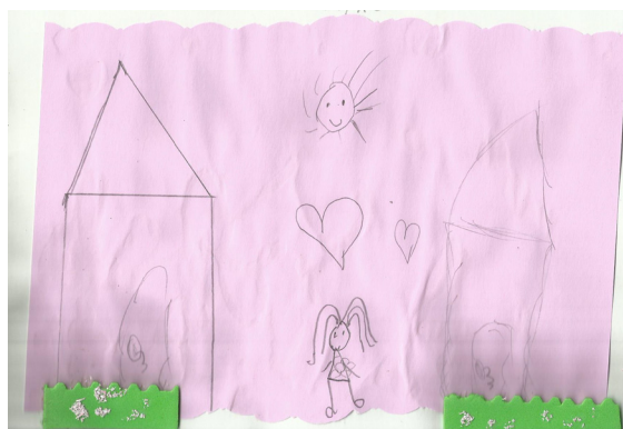
Figura 1 - Representação da família

Fonte: desenho elaborado pela criança participante.