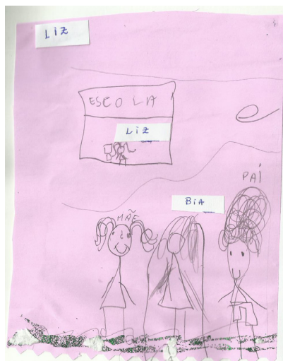
Figura 2 - Segunda representação de família