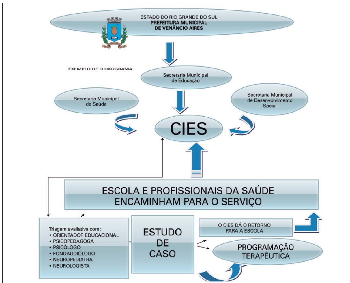
Figura 1 - Fluxograma do Centro Integrado de Educação e Saúde (CIES) de Venâncio Aires – RS.

Infantil e nos Anos Iniciais do Ensino Fundamental, quando as turmas têm um professor que trabalha as quatro horas-aulas com a mesma turma, de forma integral. Ao chegarem nos anos finais do Ensino Fundamental, os alunos da rede municipal de ensino de Venâncio Aires passam a ter aulas fragmentadas, com um professor para cada disciplina e estes normalmente não fizeram os encaminhamentos dos alunos ao CIES e não têm acesso aos laudos dos mesmos, emitidos em anos anteriores ao seu contato com a turma. Por este motivo, estes professores foram o público-alvo deste estudo.