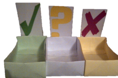
Figura 7: Caixas do jogo dos alimentos

Este jogo deverá ser apresentado à criança, no final da consulta, no sentido de testar/avaliar os seus conhecimentos sobre a cariogenicidade dos alimentos, sendo a sua realização supervisionada pelo Médico Dentista num ato de ensino ao doente após o desenlace final do jogo.