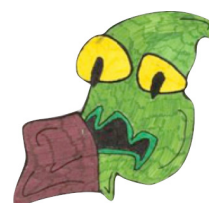
Figura 3: Pictograma: Bactéria e Cárie

No boneco "Favolas" a cárie é representada por um bicho de cor escura, na medida em que em estudos empíricos efetuados previamente, a maioria das crianças, ao desenhar a cárie, a representa como um bicho ou como lixo, ou como algo repugnante (Figura 3) 9 .