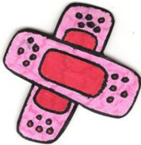
Figura 4: Pictograma: Tratamento dentário

Criámos também um pictograma que pretende representar os vulgares «pensos rápidos», simbolizando o tratamento e o material restaurador (Figura 4).