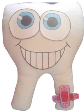
Figura 1: Favolas Feliz

O recurso ao simbólico pode então ser concebido como um processo intrapsíquico que pretende libertar o sujeito da pregnância dos objectos internos e dos fantasmas mais invasivos, servindo como um mecanismo de projecção ou de um espaço continente que possibilita, num segundo momento, uma relação com o Outro, parcialmente liberta desta pressão fantasmática 29 .