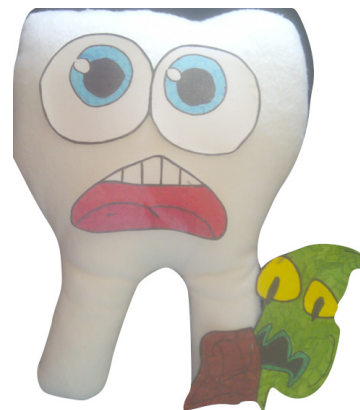
Figura 2: Favolas - doente e triste

Por outro lado, a representação pictórica de um Dente Doente , remete, para uma figura maculada pela presença de buracos e riscos/manchas, com preenchimento, fraturas, associando-se, também, a este perfil a representação pictórica de bactérias, figuradas na subcategoria "bicho"/cárie e, curiosamente, quando o Dente Doente é desenhado antropomorfizado, surge retratado como um Dente emocionalmente "Triste" 1,4 .