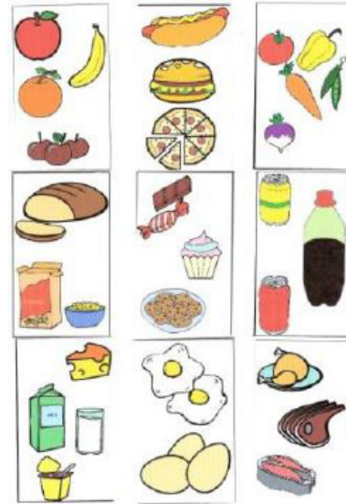
Figura 6: Cartões dos alimentos/pictogramas

cariogénicos ou não cariogénicos (simbolizada com um ponto de interrogação amarelo) ou seja dúvidas implícitas que serão esclarecidas no contexto da consulta pelo Odontopediatra (Figura 7).