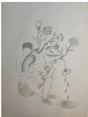
Figura 2: Segundo desenho – 03 de dezembro de 2020

O relato do estudante sobre o próprio desenho indica claramente que se trata de um autorretrato. Ele conta que sentiu tristeza, raiva, solidão, confusão, vontade de chorar e sentiu-se muito perdido. Conta que é assim que tem se sentido ultimamente, nessa posição, sentado na cama ou chorando no banho. Escreve que o desenho é ele sentado no chão de seu quarto, pensando sobre o caos que invade sua cabeça e lhe tira a paz e sobre as pessoas que já não fazem parte de sua vida.