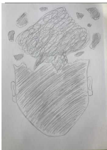
Figura 3: Terceiro desenho – 09 de fevereiro de 2021

O terceiro desenho focaliza e insinua um rosto preenchido com rabiscos, dessa vez aparecem as orelhas e o lugar onde seria a testa está cortado ou recortado, evidenciando o mecanismo de corte ( coupure ). Do centro da cabeça há um emaranhado com formato triangular e pontas arredondadas, que lembra uma explosão, e ao redor há pedaços pequenos, soltos, não integrados – provavelmente da cabeça que se abriu com a explosão. Os traços da face, na parte central e inferior, são diagonais, sem olhos, boca e nariz. Já na parte superior, o traçado é em espiral, diferenciando as duas partes. O desenho é feito em grafite, com traços que sugerem uma tentativa de sombreado. O que identifica o desenho como um rosto são os ouvidos, colocados em cada lateral, simétricos, e as formas de um rosto partido, recortado, na altura da testa.