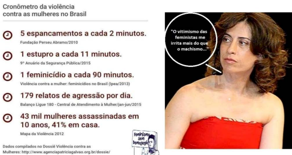
Figura 1 - Publicação da página Feminismo Sem Demagogia , 2016

Uma das declarações realizadas por participante da comunidade, derivada dessa discussão, é sustentada pelos dados sobre a violência contra a mulher apresentados na publicação e gera uma discussão acalorada.