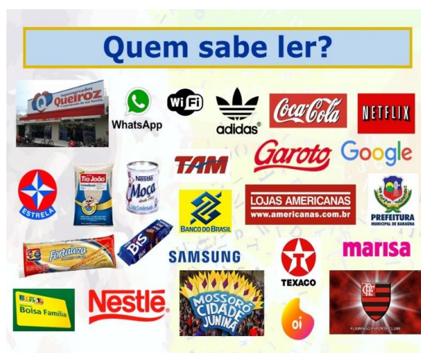
Figura 02 – algumas das imagens utilizadas na apresentação eletrônica