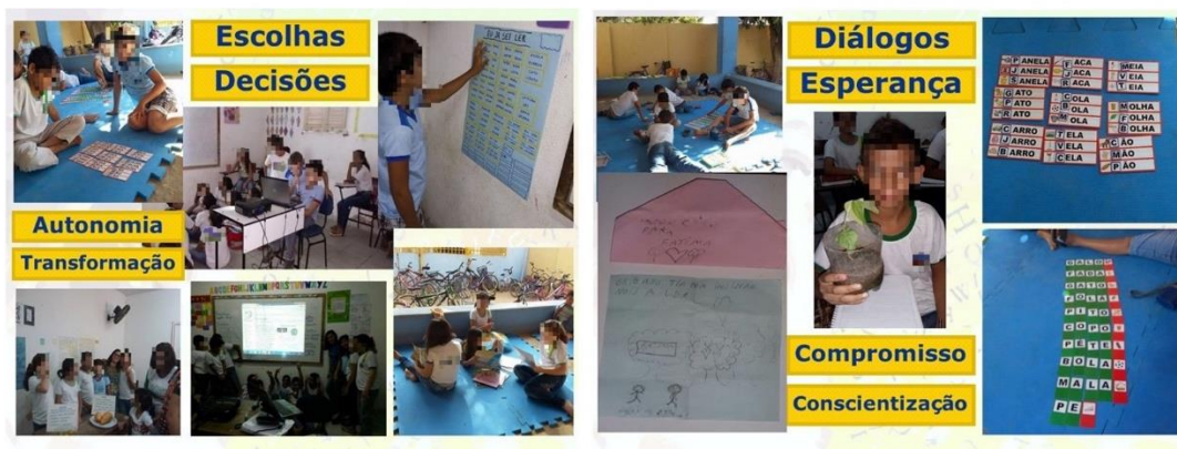
Figura 04 – Atividades vividas nas várias Oficinas

uma viagem a outro município, onde os alunos puderam assistir a um filme em uma visita ao cinema em um shopping, dos 26 estudantes, apenas um já havia ido a um cinema antes. E, tivemos ainda uma festa de encerramento, organizada em estilo de boite , pelos alunos envolvidos na pesquisa. Como se pode ver na Figura 04: