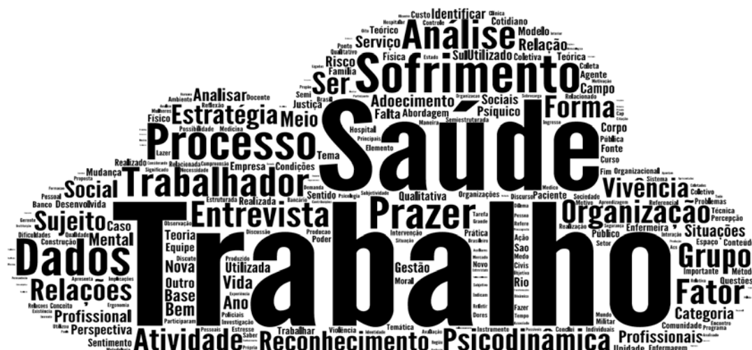
Figura 1. Nuvem de palavras.

A figura 1 evidencia as principais palavras utilizadas na construção dos resumos dos artigos pesquisados. As palavras mais frequentes nestes resumos são: trabalho, saúde, sofrimento, trabalhador, processo, psicodinâmica, organização e prazer, nesta ordem. Essas palavras estão diretamente correlacionadas com a temática principal, a PDT, como também, como mostram as quatro palavras mais frequentes, priorizam o estudo e análise do trabalho, e a sua relação com a saúde e sofrimento do trabalhador.