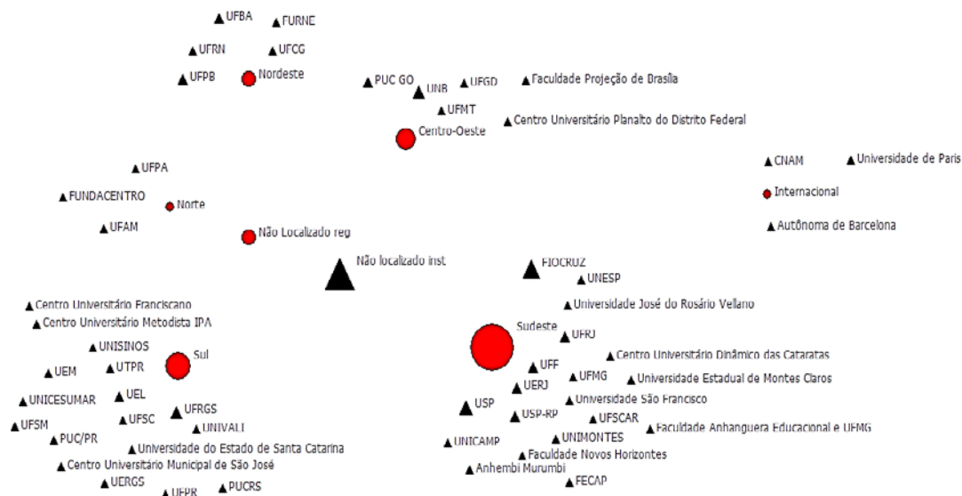
Figura 3. Rede de cooperação entre instituições e região geográfica.

Ao analisar a rede de cooperação científica entre instituições e suas respectivas regiões geográficas percebe-se que a região geográfica com maior número de cooperações é a região sudeste, seguida pela região sul, centro-oeste e nordeste. De acordo com o Borges-Andrade e Pagotto (2010), a região sudeste concentra 49% das mulheres que militam no campo do “trabalho” e das “organizações”, o que de certa forma confirma os dados desta pesquisa, mesmo que, no estudo deles, o tema tenha sido abordado em termos gerais a respeito da atuação do Psicólogo, diferentemente deste estudo, que trata de autores de trabalhos científicos. Mas, como se vê, tem grande semelhança, visto que foram destaque nos dois estudos tanto o sexo quanto a região.