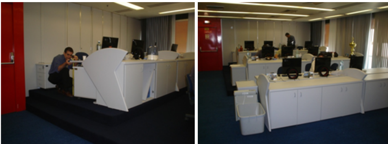
Figura 2. Bancada de monitoração de softwares

A ação ergonômica ficou delimitada à bancada de monitoramento de fraudes, tendo em vista que as atividades desenvolvidas pelos operadores desse setor são consideradas de máxima importância para a segurança dos negócios da organização (Figura 2).