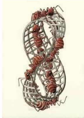
Figura 2. Banda de Moebius. Recuperado de Lacan, 1962-1963/2005a, capa.