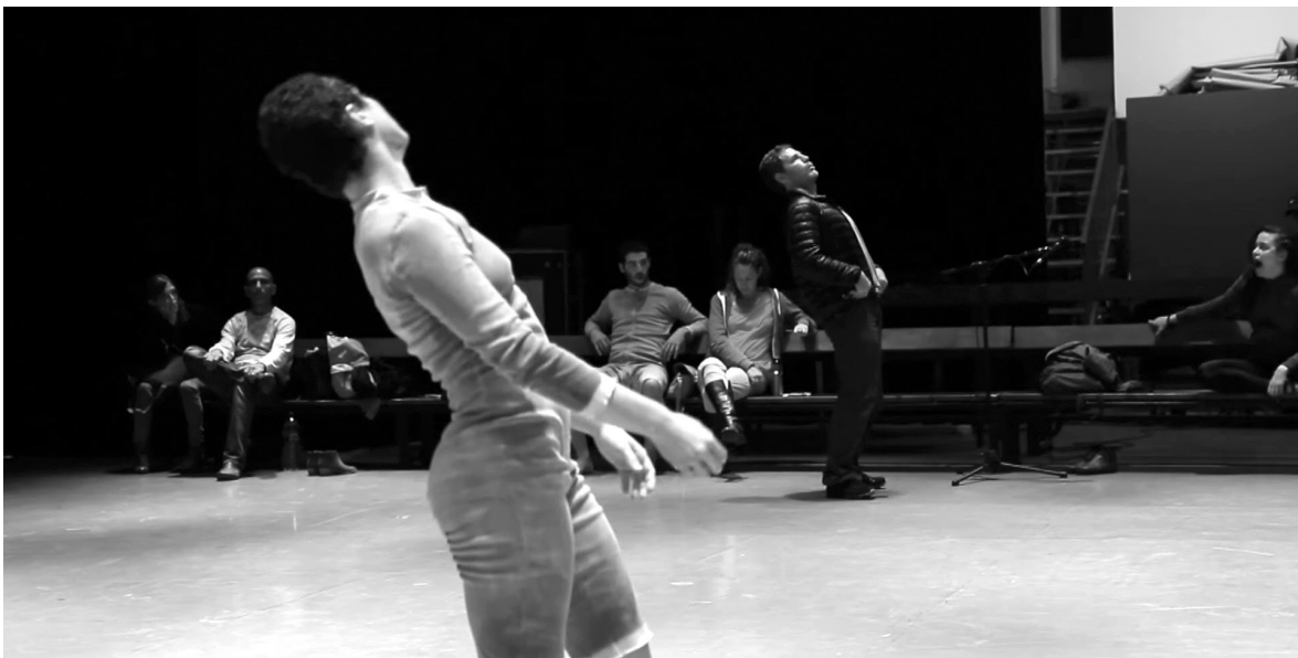
Acima e abaixo, cenas do filme Gaga – o amor pela dança (2015)