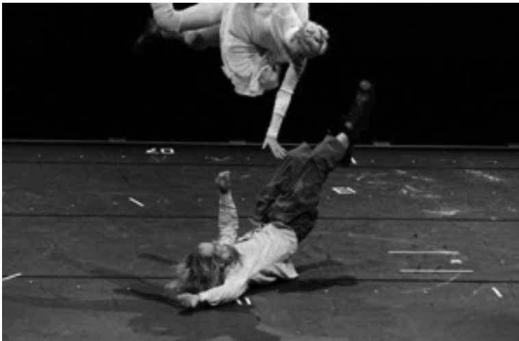
Grupo Cena 11

Colocar ritmo na queda é uma forma de aprender a cair, maneira pela qual se pode descrever um processo de análise.