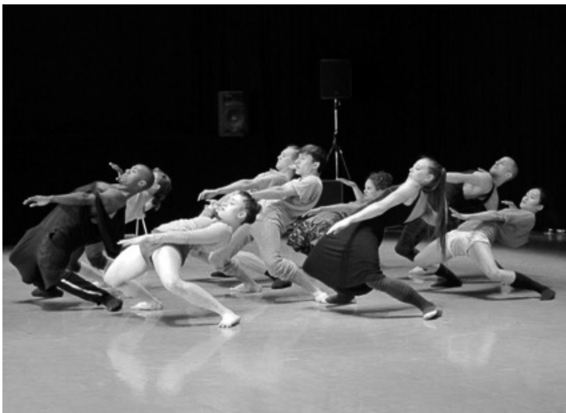
Cena do filme Gaga – o amor pela dança

“Todos temos que encontrar esses movimentos que estão esperando ser modificados, achar a conexão entre esforço e prazer, estar mais próximos a nossas sensações para ser mais instintivos, delicados, explosivos em nossos movimentos”. Baseado na imaginação e na musicalidade, completa: “Investigamos o corpo humano e seu movimento, as texturas, a força, o poder e a velocidade” 3 .