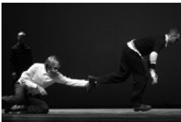
Grupo Cena 11

A queda é uma relação com o chão e, para não ser uma queda acidental e “que consiga se replicar enquanto conduta viva e capaz de gerar metáfora, ela tem um estado de controle, que também depende de cada corpo”, de acordo com Ahmed (2017).