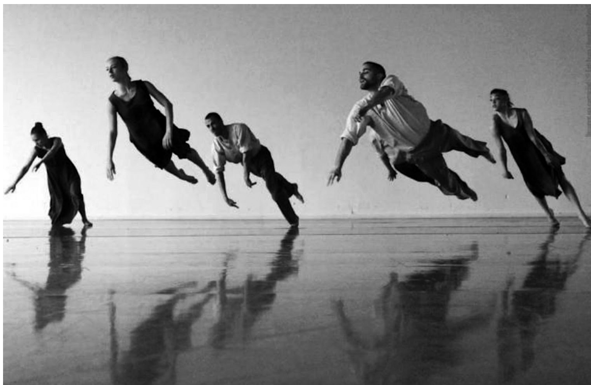
Cena do filme Gaga – o amor pela dança

Essa queda cuidadosamente medida e estudada, num misto de tensão e entrega amorosa, tem algo de contagiante, que leva junto o corpo do espectador nas experiências vividas pelos bailarinos. O cair nessa dança exerce uma atração pela forte expansão e recolhimento dos movimentos, que perfura a barreira discursiva da linguagem e está mais próxima dos ritmos do corpo e da vida.