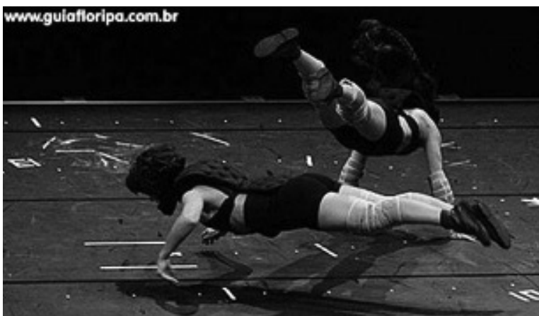
Grupo Cena 11

Em alguns momentos as suas coreografias têm um ritmo mais violento, evidenciando a força e o peso dos corpos. Os bailarinos se jogam radicalmente e se levantam com leveza, como se a queda não tivesse acontecido. Está dentro do contexto da dança contemporânea, que indica um corpo como abertura, caracterizado pela experimentação e transitoriedade.