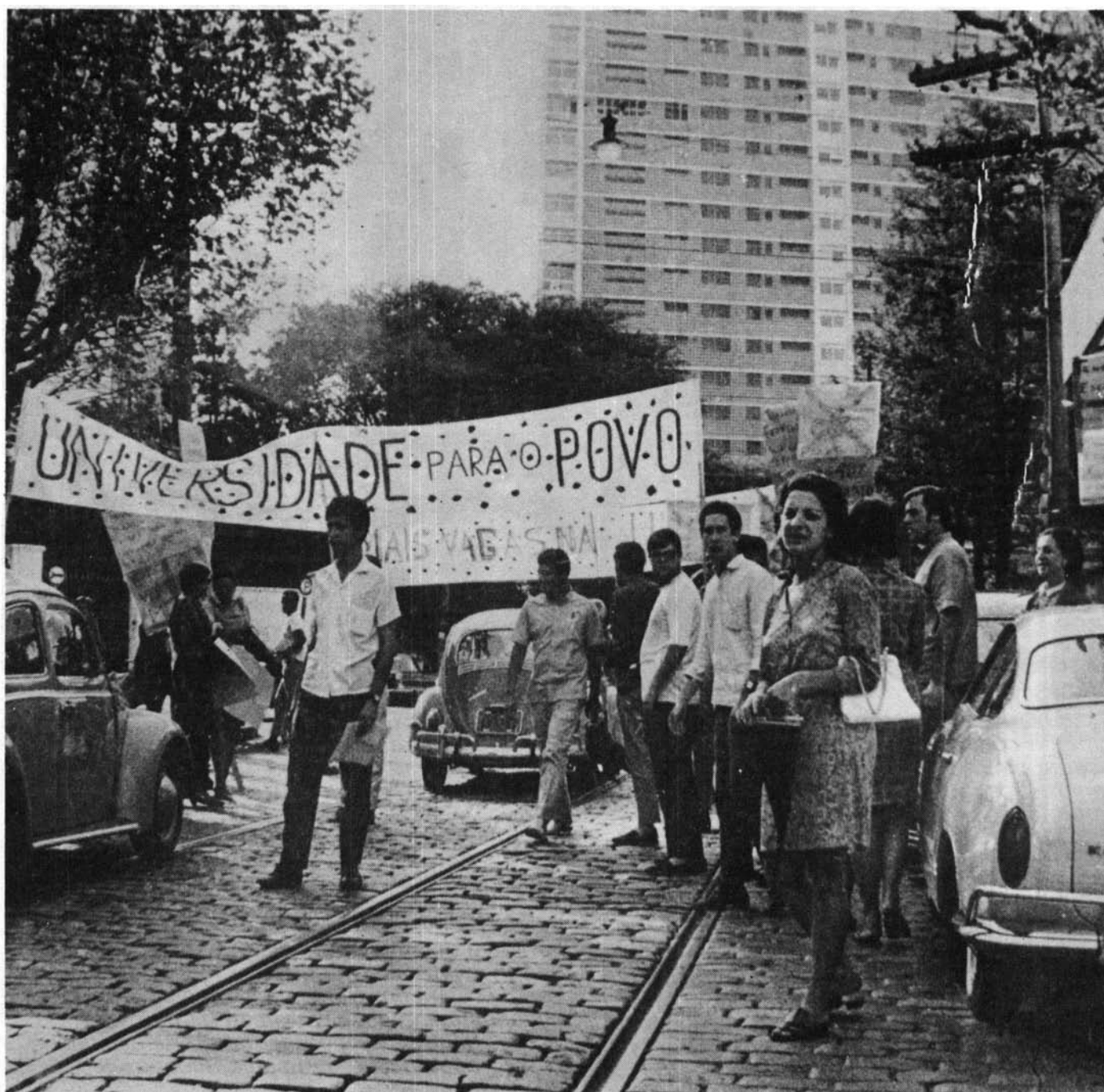
Os estudantes, com o apoio da população, resistiram à Reforma de 1968.