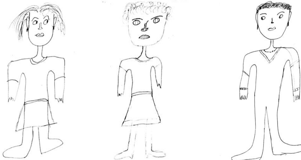
Figura 1: Desenhos 1, 2 e 3 de V., realizados durante o seu atendimento.

Às vezes eu fico com a impressão de que não gostava de mim; acho que estou ma-