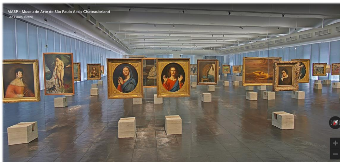
Interface Inicial do Tour Virtual do MASP

É atribuída a Alexander Graham Bell a autoria de uma grande lição de vida: “quando uma porta se fecha, outra se abre. Mas, muitas vezes, nós ficamos olhando tanto tempo, tristes, para a porta fechada, que nem notamos aquela que se abriu” (1962, p. 524). Em que pese toda a sua sabedoria avant-garde , passados mais de 140 anos de sua grande invenção, o criador do telefone dificilmente poderia imaginar a importância que sua criação ganharia em um mundo pós-moderno, marcado pelo aumento exponencial na velocidade e na quantidade de informações emitidas e recebidas, e muito menos a sua evolução em direção aos smartphones , que se vêm tornando, cada dia mais, um prolongamento do próprio corpo humano, item indispensável na rotina de um mundo globalizado e intensamente conectado.