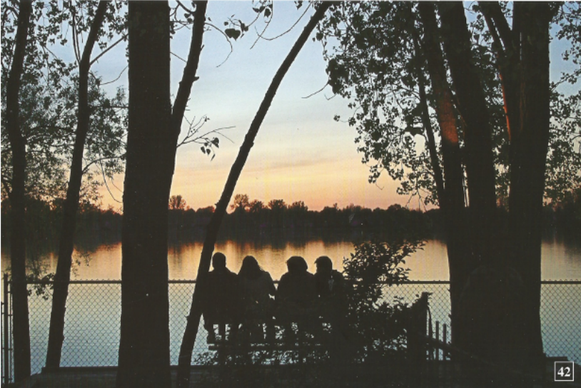
(Bélisle, 2015, fotografia 42)

Ele fala sobre o prazer de estar no meio da natureza, com os amigos, “para trocar ideias, como fazemos aqui no grupo, mesmo que o cotidiano às vezes seja difícil”.